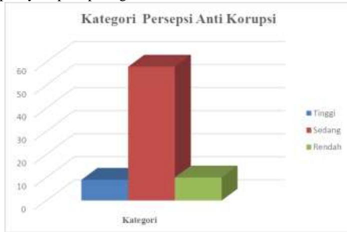
Gambar 2. Kategori Persepsi Anti Korupsi

Tanda positif pada koefisien korelasi menunjukkan bahwa arah hubungan kedua variabel tersebut adalah positif. Artinya, semakin tinggi sikap love of money maka semakin tinggi pula persepsi anti korupsi pada pegawai BKAD Kabupaten Sleman. Sebaliknya, semakin rendah sikap love of money maka semakin rendah pula persepsi anti korupsi yang dimiliki pegawai BKAD Kabupaten Sleman. Dari penelitian ini juga diperoleh kategorisasi sikap love of money subyek penelitian maupun persepsi anti korupsi nya seperti pada gambar berikut :