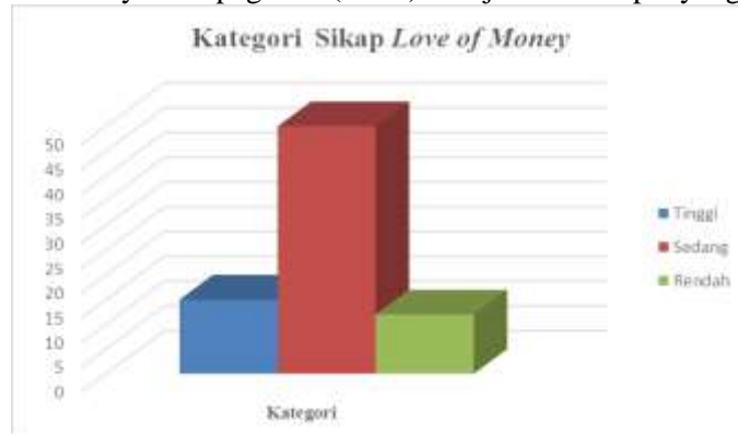
Gambar 3. Kategori Sikap Love of Money

Tabel dan diagram diatas menunjukkan bahwa pegawai BKAD Kabupaten Sleman memiliki persepsi anti korupsi yang dihitung dari 77 sampel, pegawai yang memiliki kategori rendah sebanyak 10 pegawai (13 %), pegawai yang memiliki kategori sedang sebanyak 58 pegawai (75 %) dan pegawai yang memiliki kategori tinggi berjumlah 9 pegawai (12 %). Jadi, dapat disimpulkan bahwa kecenderungan persepsi anti korupsi pegawai BKAD Kabupaten Sleman berada pada kategori sedang yaitu sebanyak 58 pegawai (75 %) dari jumlah sampel yang berjumlah 77 pegawai.